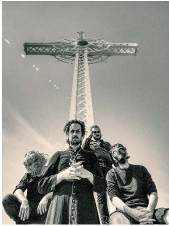
Le groupe Saints Martyrs

leurs carnets, les deux artistes créeront un paysage sonore hypnotique qui laissera place à une méditation sur la violence coloniale. Une lecture de trois poètes, le jeune Matai Stevens, Mimi Haddam et le bien aimé Jean-Paul Daoust , précédera cette performance musicale.